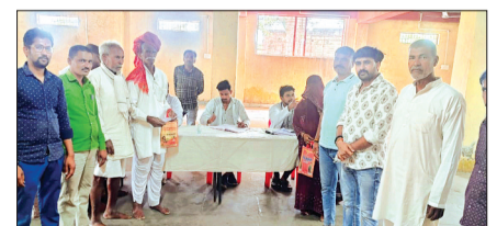
बीमारियों के 58 मरीज का स्वास्थ्य प्रशिक्षण हुआ। इनमें से 16 मरीजों को उचित उपचार के लिए गुरुवार को एम्बुलेंस से देवास लेजाया जाएगा।

नलखेड़ा। तहसील के नगरीय क्षेत्र बड़ागांव में खेड़ापति हनुमान बावड़ी पर उद्य प्रेड्स क्लब के सहयोग से अमलतास अस्पताल देवास द्वारा निःशुल्क स्वास्थ्य शिविर का आयोजन किया गया। स्वास्थ्य शिविर में 58 मरीजों का परीक्षण किया गया, जिसमें से 16 को निःशुल्क देवास ले जाकर उचित उपचार किया जाएगा। बुधवार को बड़ागांव में आयोजित निःशुल्क स्वास्थ्य परीक्षण शिविर में नगर व आसपास के ग्रामीण नागरिकों ने शिविर में भाग लेकर अपनी स्वास्थ्य संबंधी समस्याओं का निवारण करवाया। शिविर में विभिन्न