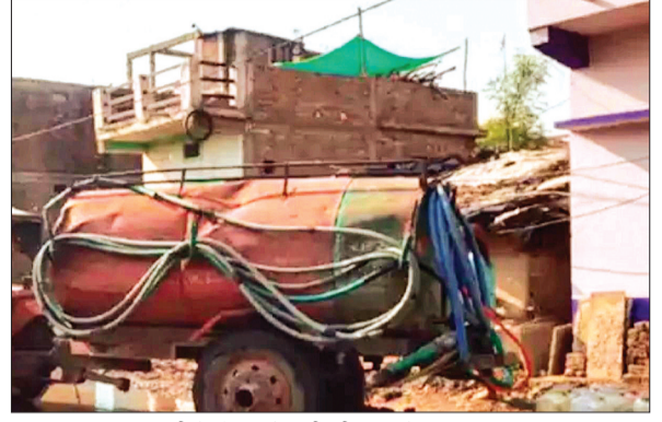
आष्टा। इस तरह पानी के टैकर से पानी की कर रहे व्यवस्था।