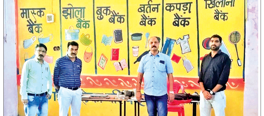
हरिभूमि न्यूज ► आष्टा