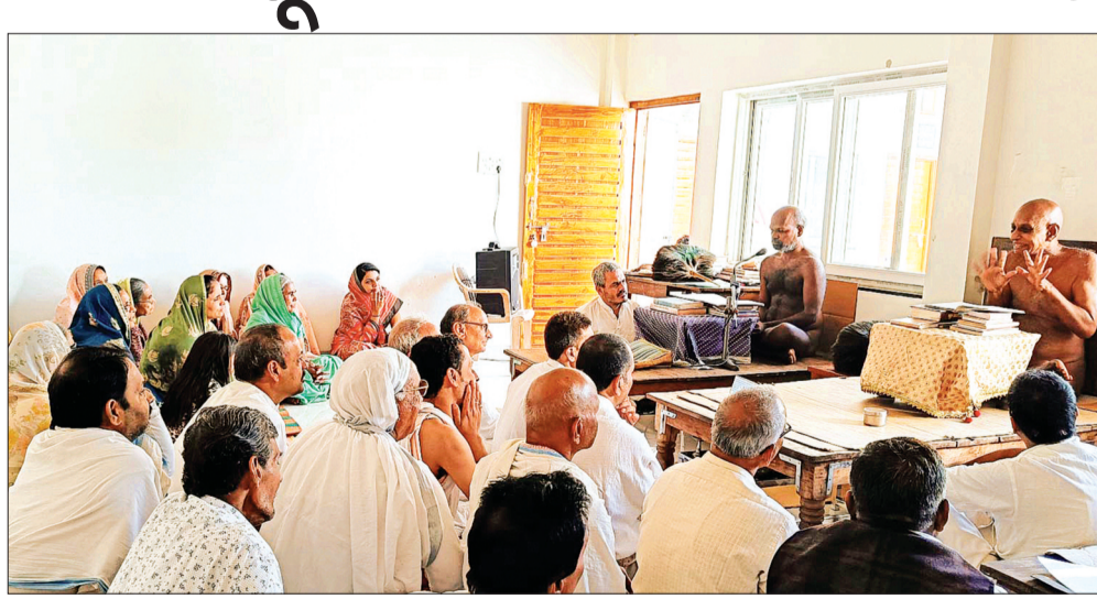
हरिभूमि न्यूज ► आष्टा

प्रेम से रहने का नाम साधुवाद है। सभी के हित मित की बात करे।पल-पल में बदलाव होता है और पल-पल में पाप हो रहा है। समुद्र कभी भी अपना स्वभाव नहीं बदलता है।सास- बहू